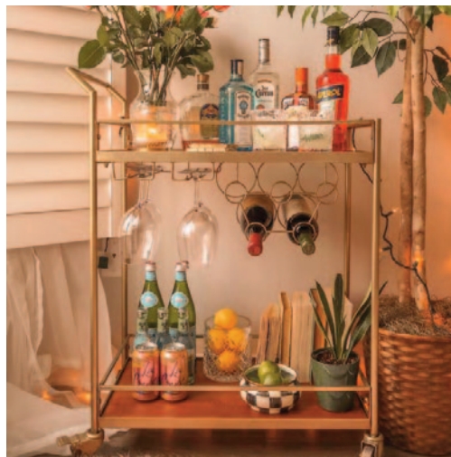
Carrinho de bebidas