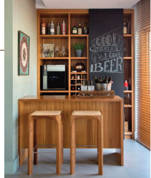
Adegas com móveis planejados: adega na sala, adega na cozinha e adega na varanda